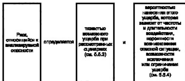
Рисунок 3 — Риск и его составляющие

5.5.2.2 Составляющие риска приведены на рисунке 3.