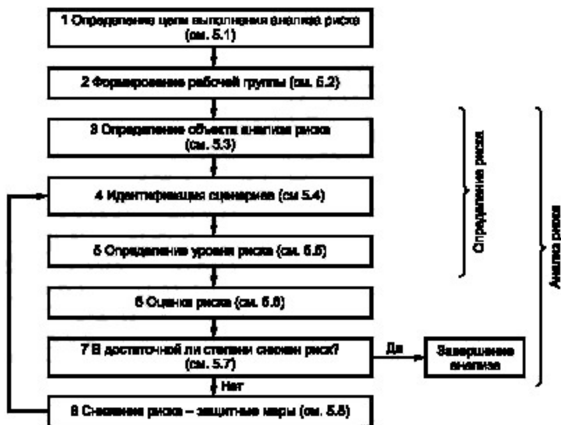
Рисунок 1 — Схема выполнения анализа и снижения риска